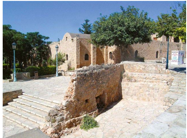
Αποψη του Μεσαιωνικού Μοναστηριού Αγίας Νάπας στο κέντρο της πόλης, όπου κατέληγε σύμφωνα με τα ευρήματα το Υδραγωγείο.

Το αίτημα του Δήμου τέθηκε από κοινού με τον αδελφοποιημένο Δήμο Ρέθυμνου - Κρήτης, για τον οποίο η χρηματοδότηση αφορούσε την αποκατάσταση για χρήση δύο οικοδομημάτων της Ενετοκρατίας που βρίσκονται στα δημοτικά όρια Ρέθυμνου. Η χρηματοδότηση έγινε κατά 50% από την Ευρωπαϊκή Ένωση (Ευρωπαϊκό Ταμείο Περιφερειακής Ανάπτυξης) και 50% από Εθνικούς Πόρους. (Συνέχεια στη σελίδα 2).