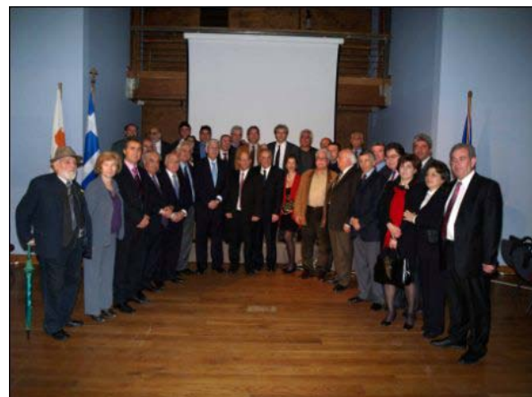
Από την τελετή διδυμοποίησης

Επίσης, κατά τη διάρκεια της τελετής διδυμοποίησης, προβλήθηκε ταινία της κατεχόμενης Αμμοχώστου, ενώ υπογράφηκε από τους δυο Δημάρχους πρωτόκολλο φιλίας και συνεργασίας, ηθικής στήριξης και έκφρασης αλληλεγγύης για τη διαρκή αντίσταση και αγώνα για τη ελευθερία. Μετά την ανταλλαγή των αναμνηστικών δώρων παρουσιάστηκαν χοροί της Κρήτης και της Κύπρου από το χορευτικό συγκρότημα του Δήμου Χανίων.