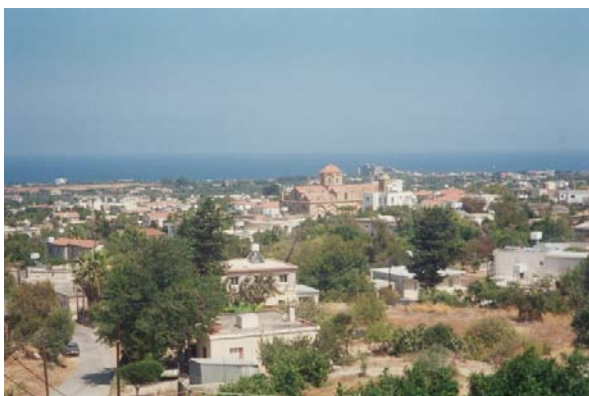
Γενική άποψη της κωμόπολης Καραβά

Μόνη διέξοδος αναπλήρωσης του μεγάλου κενού που αφήνει πίσω της η γενιά που φεύγει είναι η δραστηριοποίηση της νέας»