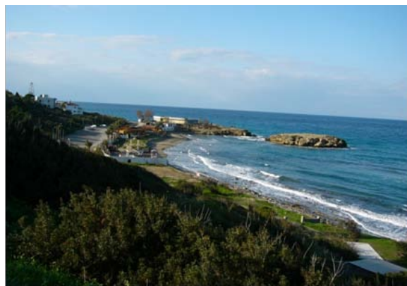
Παραλία «Πέντε Μίλι» στον Καραβά – Περιοχή όπου οι Τούρκοι εισβολείς πραγματοποίησαν την πρώτη απόβασή τους στις 20 Ιουλίου 1974

δημιούργησαν πάμπολλα προβλήματα τα οποία οι Καραβιώτες και οι υπόλοιποι πρόσφυγες πρέπει να αντιμετωπίσουν με πολλές θυσίες.