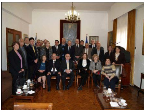
Υποδοχή της αντιπροσωπείας του Δήμου Αμμοχώστου από το Δήμαρχο και μέλη του Δημοτικού Συμβουλίου Χανίων στο Δημαρχείο Χανίων

Η φιλοξενία που πρόσφεραν ο Δήμαρχος και το Δημοτικό Συμβούλιο Χανίων προς τα μέλη της αντιπροσωπείας του Δήμου Αμμοχώστου ήταν πάρα πολύ ξεχωριστή. Μαζί όμως με τη μοναδική κρητική φιλοξενία, ο Δήμαρχος και τα υπόλοιπα μέλη της αντιπροσωπείας του Δήμου Αμμοχώστου έλαβαν ένα αναβάπτισμα ελπίδας αλλά και συνέχισης του αγώνα μέχρι την πολυπόθητη επιστροφή στην κατεχόμενη μας γη.