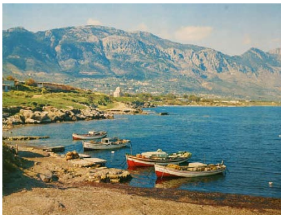
Το λιμανάκι της αρχαίας Λάμπουσας, στον Καραβά

Με ένα ξεχωριστό τρόπο βιώνει επίσης το αξίωμα του Δημάρχου, ο Δήμαρχος Καραβά κ. Ιωάννης Παπαϊωάννου και όλοι οι υπόλοιποι Δήμαρχοι των κατεχομένων Δήμων, οι οποίοι επιτελούν μια ποικιλόμορφη και δύσκολη αποστολή μακριά από το γεωγραφικό χώρο των περιοχών τους.